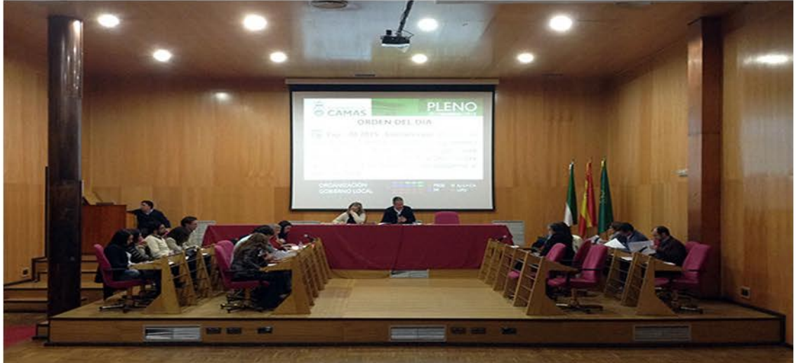
Corporación local en un momento del pleno correspondiente al mes de febrero de 2015.

El grupo socialista presentó una moción, apoyada también por IU, en favor de los derechos de la mujer con motivo de la celebración del 8 de Marzo. UPyD acaparó gran parte del pleno con tres mociones.